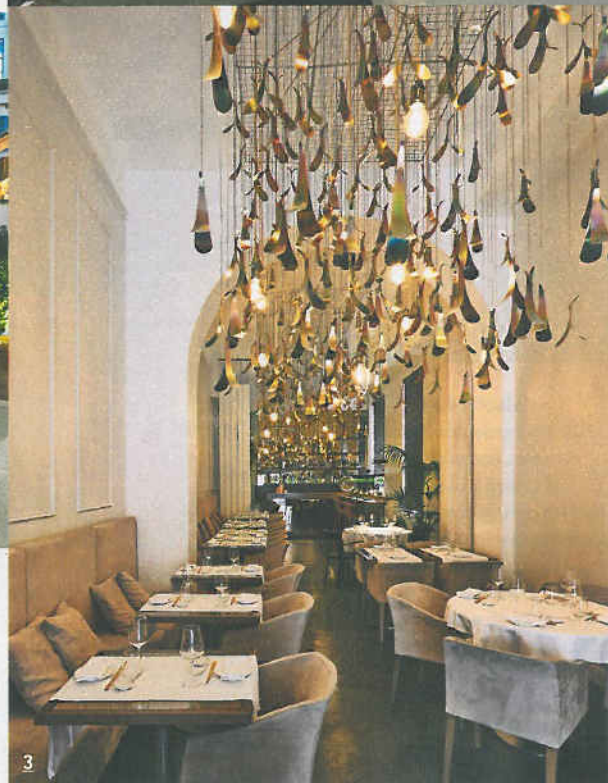
1 Un angolo dell' Aimo e Nadia BistRo . Gli arredi sono firmati Rossana Orlandi e Etro Home. 2 L'ampio déhor di Paper Moon Giardino , dove è possibile anche sorseggiare un tè pregiato o prendere l'aperitivo open air. 3 Il nuovo fusion Cinquantadue . La sala sviluppata per il lungo è dominata dal lampadario realizzato su misura con una jewelry designer tailandese.