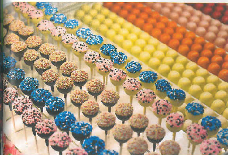
4 I dolcetti pop del pasticciere Roberto Rinaldini .