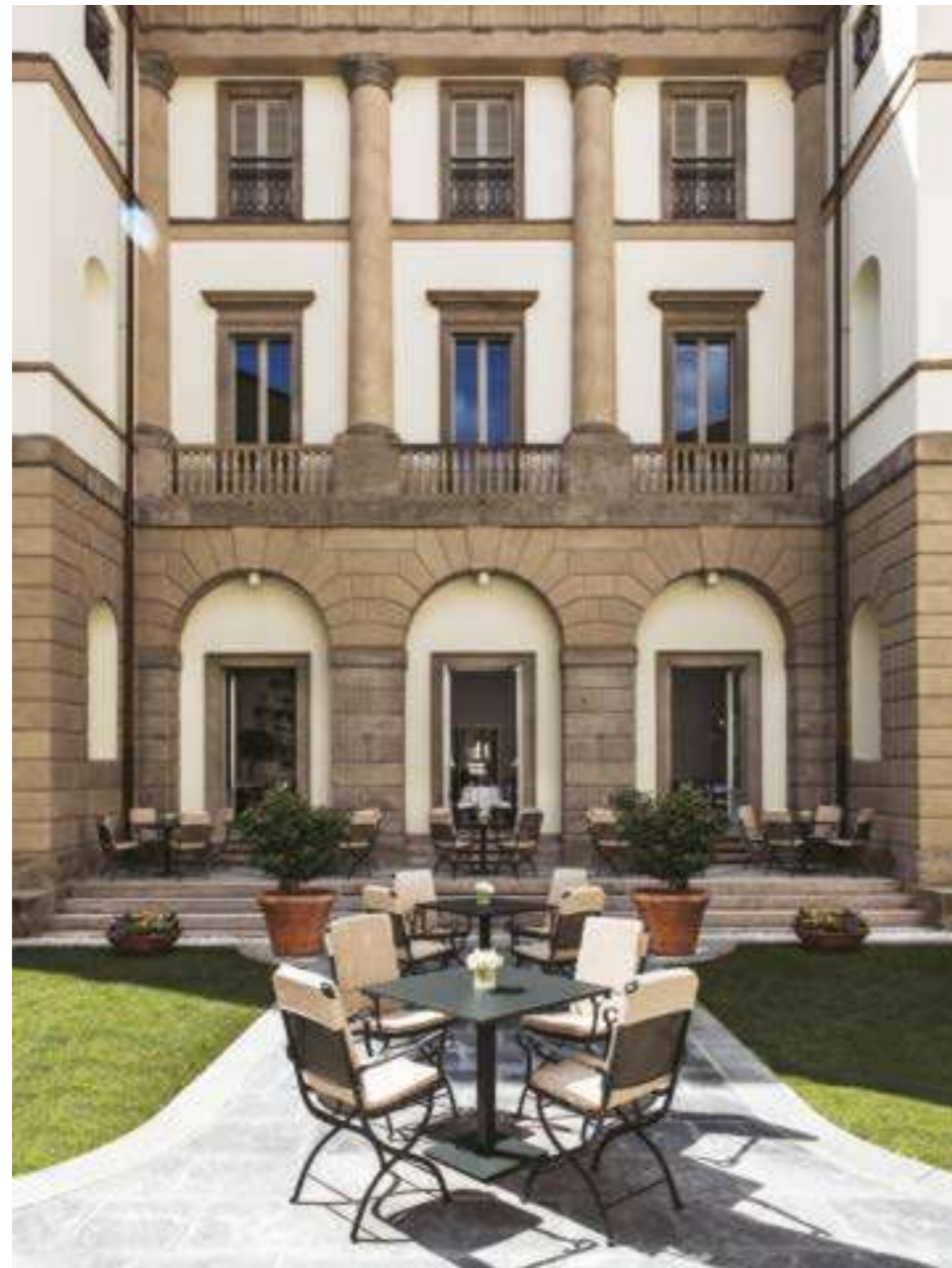
A cura di Anguilla Segura